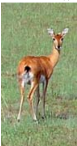
Unten: Oribi, Kaffertrappe