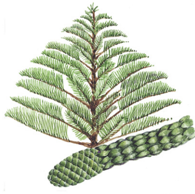
Norfolk Island Pine* Norfolktanne* Zimmertanne* Araucaria heterophylla* ( Araucaria excelsa* )

Klasse: Nacktsamer, Gymnospermae Ordnung: Kiefernartige, Pinales Familie: Araukariengewächse, Araucariaceae Aussehen: Bis 60 m hoher Baum. Der Stamm, in der unteren Hälfte meist astfrei, hat einen Durchmesser bis 8,5 m. Erreicht die volle Größe erst mit 1500 Jahren, Alter bis 4000 Jahre. Der wohl beeindruckendste Baum Neuseelands. Rinde: Braun bis aschgrau, schuppt regelmäßig ab, daher kaum Epiphyten am Stamm. Standort: Nördliche Küstenwälder. Im Waipoua Forest: »Tane Mahuta«, mit 51,5 m der höchste noch lebende Kauri, Alter etwa 2000 Jahre. Blätter: Die «Nadeln» sind eiförmig, mittelgrün, flach, ledrig, bis 4 cm lang und 1 cm breit. Samen: Am gleichen Baum: maiskolbenartige männliche und kugelförmige weibliche Zapfen, mit geflügelten Samen unter den Schuppen. Nutzen: Vielfältig bei Maori: z.B. das Holz zum Kanu- und Hausbau, Kauriharz als Feueranzünder. - Die Europäer nutzten das leichte Holz (u.a. für Schiffe, Häuser, Möbel) und das Harz als Firnis für Lacke und Linoleum bzw. als Kauri-Kopal (Neuseeländischer Bernstein) für Schmuck. Heimat: Neuseeland. Es überlebten nur 4 % der ehemaligen Kauriwälder. Vergleiche: →Queensland-Kauri (Australien). Allgemeines: Siehe →Norfolktanne (Neuseeland).