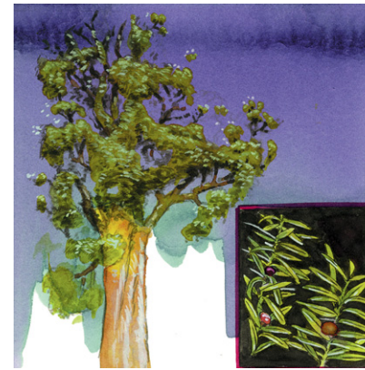
Totara Totara Totara-Steineibe Podocarpus totara

Klasse: Nacktsamer, Gymnospermae Ordnung: Kiefernartige, Pinales Familie: Araukariengewächse, Araucariaceae Aussehen: Immergrüne, kegelförmige Konifere, bis 60 m hoch; Äste sind spiralg angeordnet und leicht aufsteigend, fächerförmiges Blattwerk. Blätter: Nadelartig, 5-10 mm lang, in spiralgiger, schuppenförmiger, um den Zweig herum dicht gedrängter Anordnung. Samen: Zapfen, bis zu 13 cm groß. Samen nur alle 3 Jahre. Heimat: Norfolk Island (zwischen Australien und Neuseeland). Nutzen: Früher beehrter Stamm für Segelschiff-Masten. Heute als salztoleranter Baum häufig an den Küsten Neuseelands angepflanzt, auch weltweit in warm-gemäßigten Regionen. In Mitteleuropa als »Zimmertanne« eine beliebte Topfpflanze. Auch geschätzter Forstbaum. Vergleiche: →Neuseeländischer Kauri-Baum; im Australien-Teil: →Norfolktanne, →Queensland-Kauri, →Bunyatanne, →Hoop-Schmucktanne. Allgemeines: Araukarien (insgesamt 3 Gattungen mit 41 Arten) sind benannt nach dem Ort Arauco in Chile und gelten als »altertümliche« Nadelbäume, u.a. wegen der Nadelstruktur. Als »Gondwanapflanzen« sind sie fast nur auf der Südhalbkugel beheimatet.